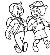
de la randonnée