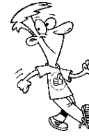
de la marche