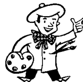
de la peinture