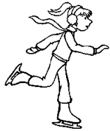
du patinage sur glace