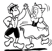
de la danse