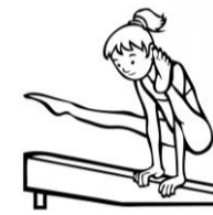
de la gymnastique