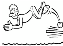
de la natation