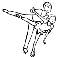
du patinage artistique